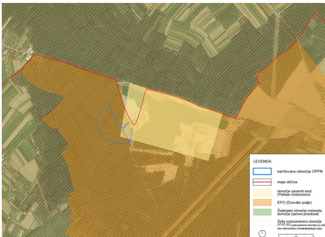
Slika 7: Varstvena, zavarovana, degradirana in ogrožena območja

Območje OPPN se nahaja na območju širšega vodovarstvenega območja VVO III, življenjskem območju rjavega medveda, na ekološko pomembnem območju (EPO) – Dravsko polje (ev. št. 42500), del območja je opredeljen tudi kot naravna vrednota Pleterje – Gramoznica lokalnega pomena.