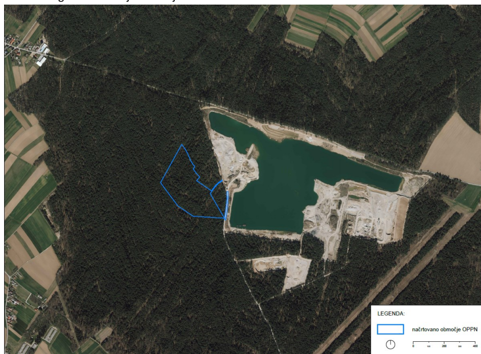
Slika 2: Digitalni ortofoto