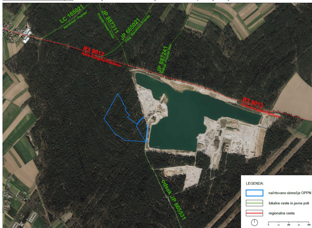
Slika 5: Prometno omrežje

Prometno omrežje : Območje OPPN se na južni strani priključuje na občinsko cesto JP 665531.